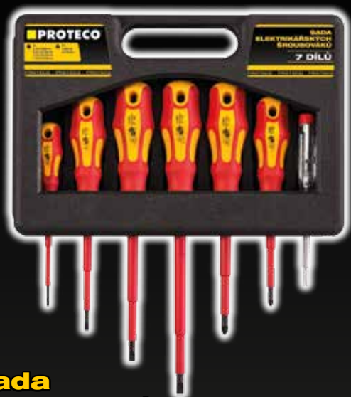
Sada šroubováků pro elektrotechniku